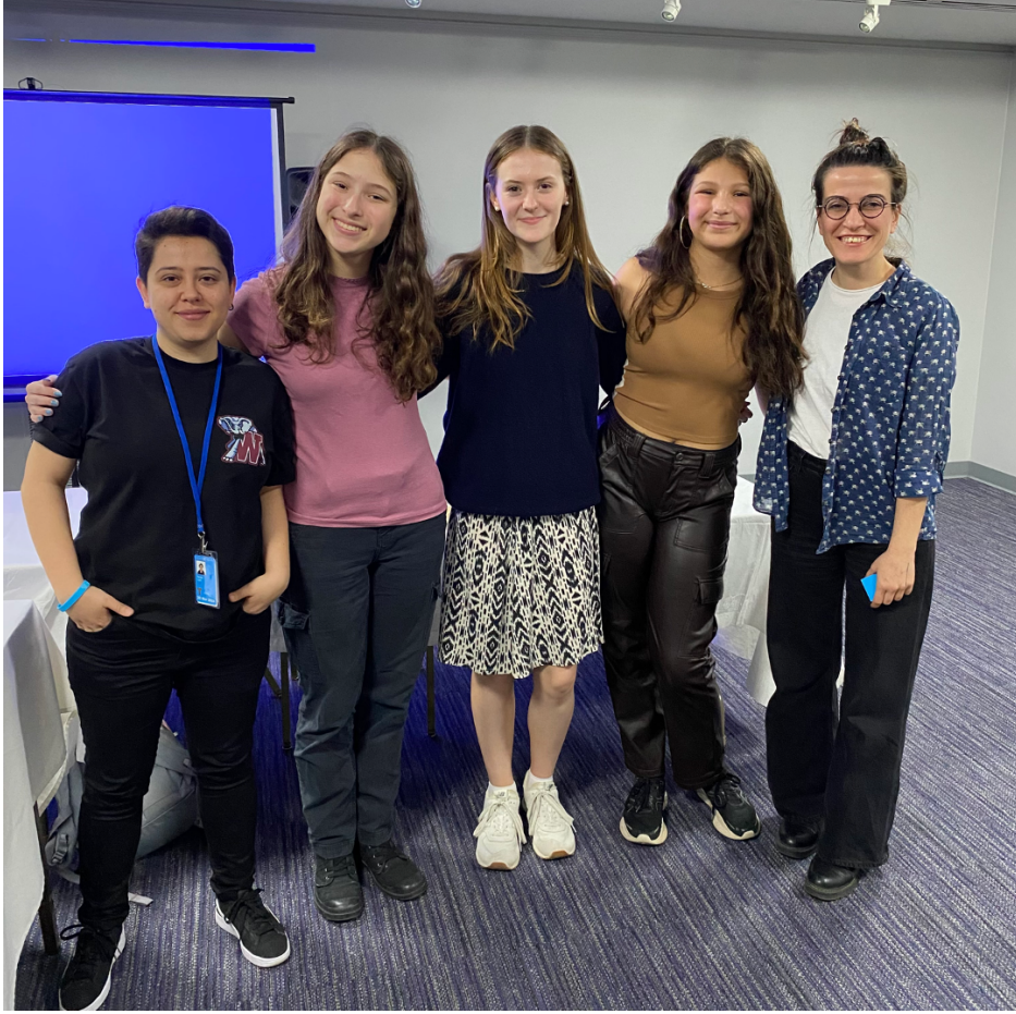
CŞMD Ne Var Ne Yok?! Gençlik Programı ekibi, atölyeyi gerçekleştiren One Love'dan gençlerle beraber, 14 Mart 2024