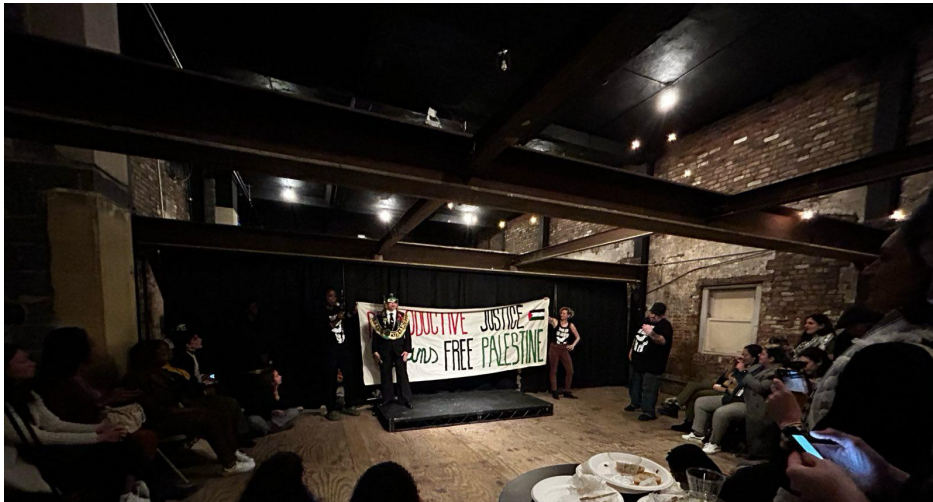
AWID Feminist Topluluk Etkinliği, 13 Mart 2024

AWID'in düzenlediği feminist topluluk etkinliği, KSK ortamında sivil toplumun birbiriyle tanışması, ağ kurması ve dayanışması için bir alan açtı. Etkinlikteki açılış konuşmalarında özellikle devletlerin muhafazakarlaştığı ve sivil toplum örgütlerinin bunun gibi güç ilişkilerinin sürdüğü bir ortamda bulunmasının oldukça önemli olduğu vurgulandı. Özellikle