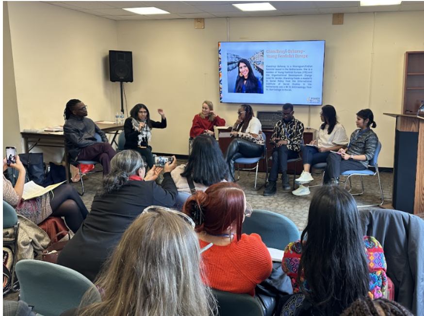
Genç Dostu Feminist Fonlama Etkinliği, CHOICE, 19 Mart 2024

Genç Dostu Feminist Fonlama (Youth-Friendly Feminist Funding):