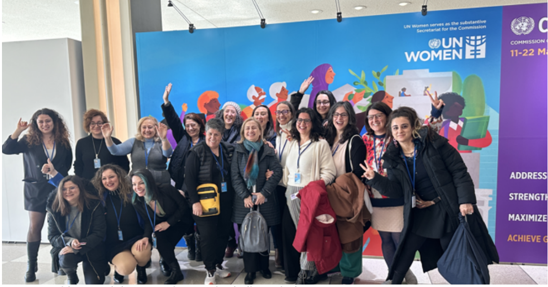
KSK68 Türkiye Feminist ve Kadın Hareketi Bileşenleri, Mart 2024