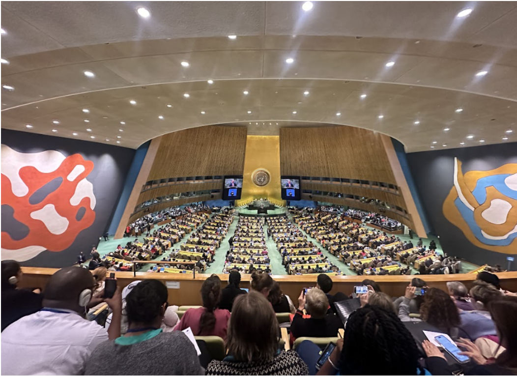
KSK68 Açılış Töreni, BM Genel Merkezi, New York City, ABD, 11 Mart 2024

KSK68'i resmen başlatan Açılış Töreninde toplumsal cinsiyet eşitliği ve kadınların güçlendirilmesine yönelik güçlü bir taahhüt vurgusu yapıldı ve kadın ve kız çocuklarının güçlendirilmesinin önündeki engellerden bahsedildi. Ancak toplumsal cinsiyet eşitliği ve hak karşıtı hareketlerle somut olarak nasıl mücadele edileceği ve nasıl bir yol izleneceğine ilişkin bilgi verilmedi.