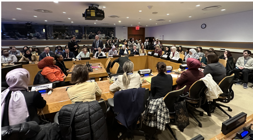
Türkiye Cumhuriyeti Hükümet Oturumu, "Anlatılmayanları Ortaya Çıkarmak: Çatışmanın Kadınlar ve Kız Çocukları Üzerindeki Yıkıcı Etkisi", 12 Mart 2024

Türkiye Cumhuriyeti Hükümet Oturumu, "Anlatılmayanları Ortaya Çıkarmak: Çatışmanın Kadınlar ve Kız Çocukları Üzerindeki Yıkıcı Etkisi" (Unveiling the Untold - The Devastating Impact of Conflict on Women and Girls):