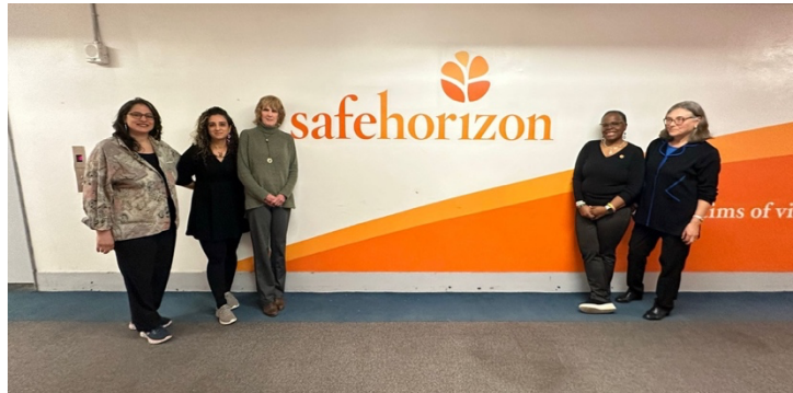
Safe Horizon ile görüşme, 18 Mart 2024

Safe Horizon 6 ile görüşme: Safe Horizon, 1978 yılından bu yana New York'ta şiddet ve istismardan hayatta kalanlara destek sağlayan bir kuruluştur. Bu örgüt bünyesinde 20 Aile Adalet Merkezi (Family Justice Center) faaliyet göstermekte ve toplam 800 kişi çalışmaktadır. Kurum; ev içi şiddet, cinsel istismar, cinsel saldırı, ısrarlı takip, insan kaçakçılığı, genç evsizliği, ırkçılık ve diğer suçlara maruz bırakılanlara yönelik kapsamlı ve bütünlükçü destekler sağlamakta ve bu alanda savunuculuk faaliyetleri yürütmektedir. Safe Horizon ile gerçekleştirilen bu toplantıda, şiddete maruz bırakılanlara yönelik hizmetler ve sağladıkları destekler hakkında bilgi alışverişinde bulunduk. Olası işbirlikleri için iletişimde kalmaya karar verdik.