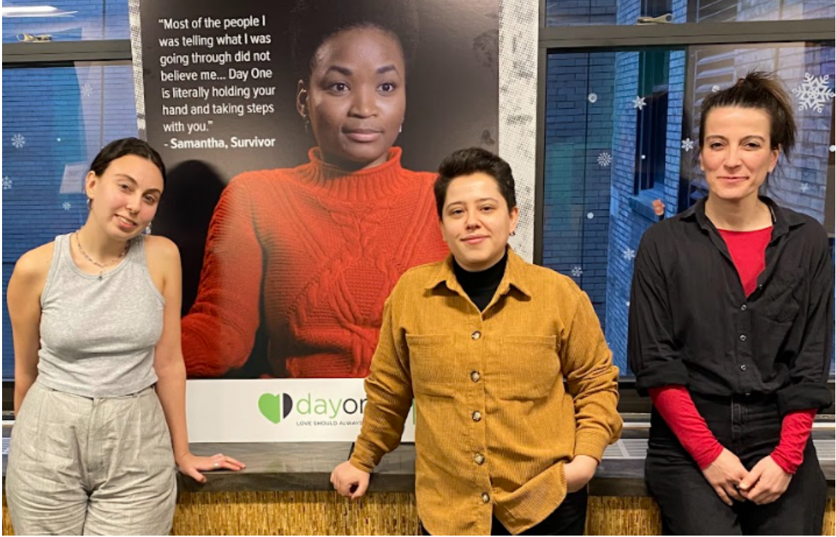
Day One New York ofis ziyareti, 13 Mart 2024

One Genç Danışma Kurulunu bir araya getirme fikrini değerlendirdik. Ürettikleri bilgilendirici yayınları edindik ve olası işbirlikleri için iletişimde kalmaya karar verdik.