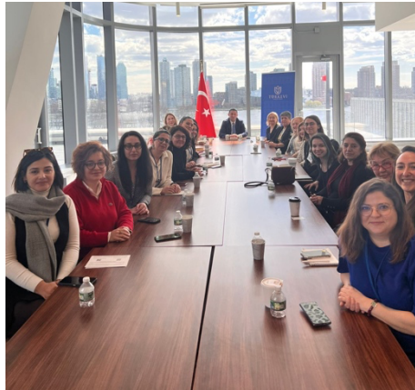
Türkiye New York Başkonsolosluğu Görüşmesi, 18 Mart 2024

Türkiye'nin New York Başkonsolosu ile görüşme: Türkiye kadın, feminist ve LGBTİ+ hareketinden bileşenler, Türkiye'nin New York Başkonsolosu Reyhan Özgür ile özel bir toplantıda bir araya geldi.