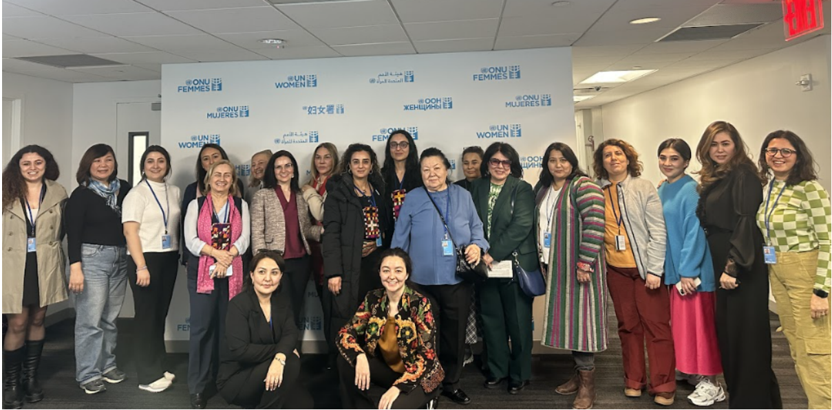
Kırgızistan ve Özbekistan'dan Sivil Toplum Örgütleri ile buluşma, 13 Mart 2024

Toplumsal Cinsiyet Eşitliği Perspektifiyle Afet Riskinin Azaltılması ve Yönetiminde Lider Kadınlar (Women Leading in Disaster Risk Reduction and Management with a Gender Equality Perspective):