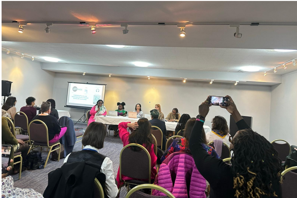
Yoksulluğun Ortadan Kaldırılması ve LBTİ Topluluğu İçin Ekonomik Kapsayıcılığın Geliştirilmesi, 15 Mart 2024

Yoksulluğun Ortadan Kaldırılması ve LBTİ Topluluğu İçin Ekonomik Kapsayıcılığın Geliştirilmesi (Eradicating Poverty and Advancing Economic Inclusion for LBTI Community):